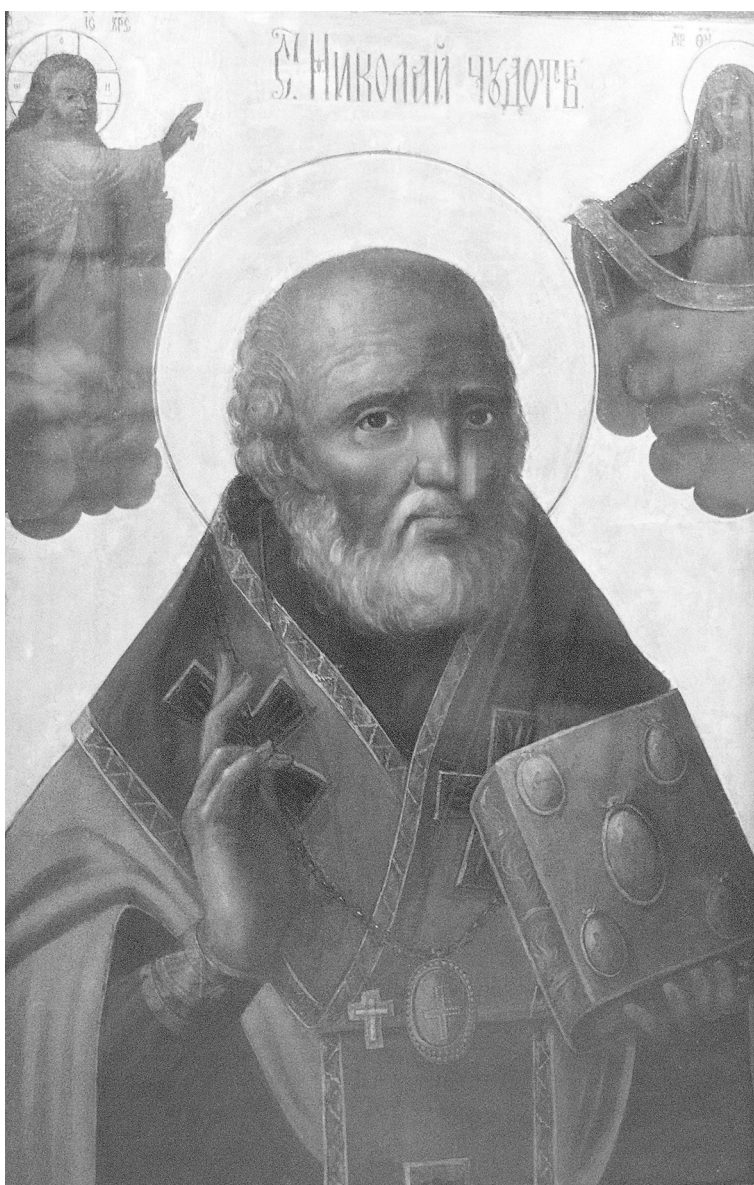
Икона свт. Николая. XIX век. Знаменский храм. Дубровицы

Смутные черты образа Деда Мороза можно найти в традиционной святочной обрядности. Например — в маске святочного деда, одного из ряженных.