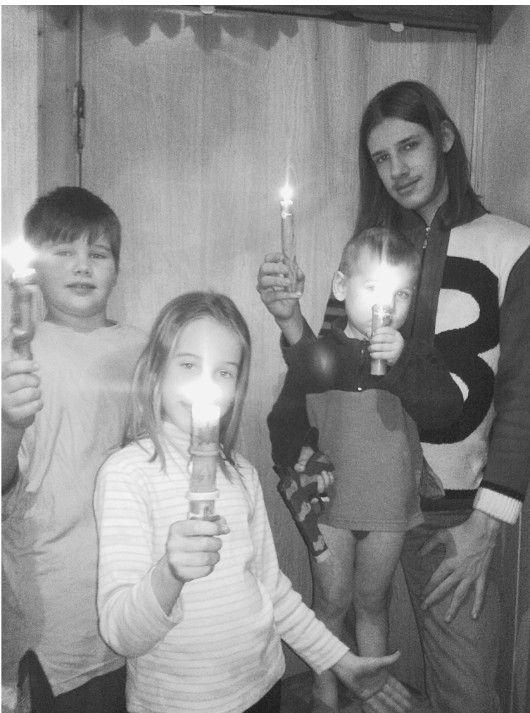
Встреча Рождества Христова со свечами, сделанными своими руками

На всенощных бдениях мы слышим уже негромкое трогательное песнопение «Христос рождается,