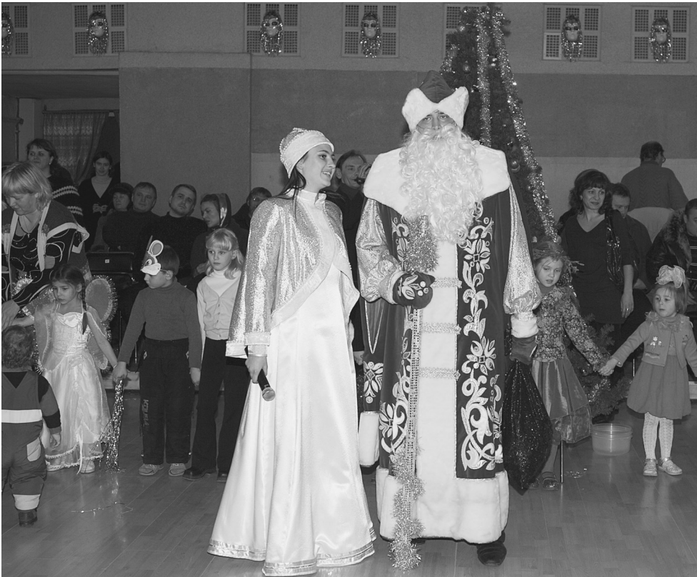
Рождественский праздник в Дубровицах в 2008 году.

А может и есть смысл в том, что праздник Рождества приходит тихо и почти незаметно для многих после шумных новогодних каникул... А от нас, родителей, зависит, достигнется ли в наши сердца и сердца наших детей тихая радость этого праздника.