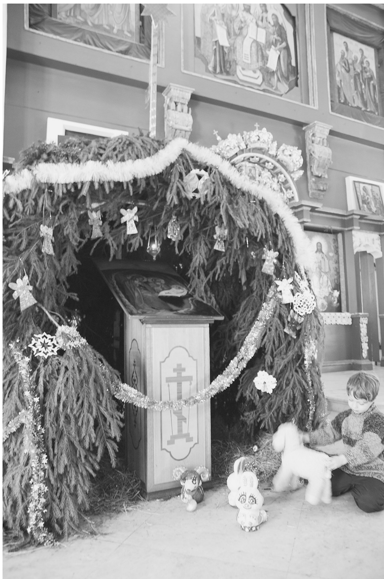
Рождественский вертеп в Дубровицком храме, украшенный поделками детей воскресной школы

Если говорить о теме Рождества в русской литературе, то кроме произведений И. Шмелева, известных почти всем, можно назвать еще очень много рус-